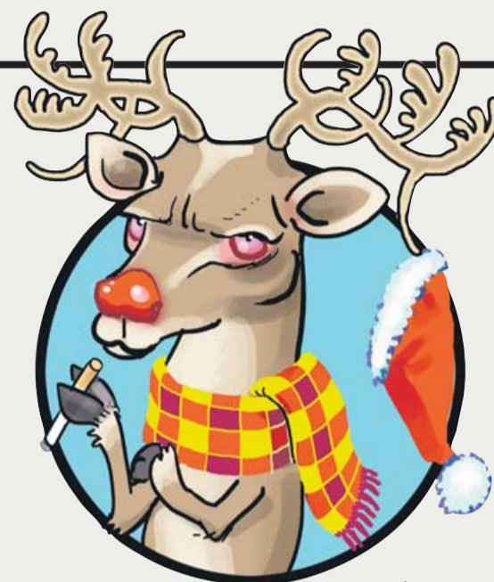
ILUSTRACIÓN: GUILLEM MARCH

Rouco Varela aclara: "No apostatar es obligatorio si eres cardenal". Se entiende.